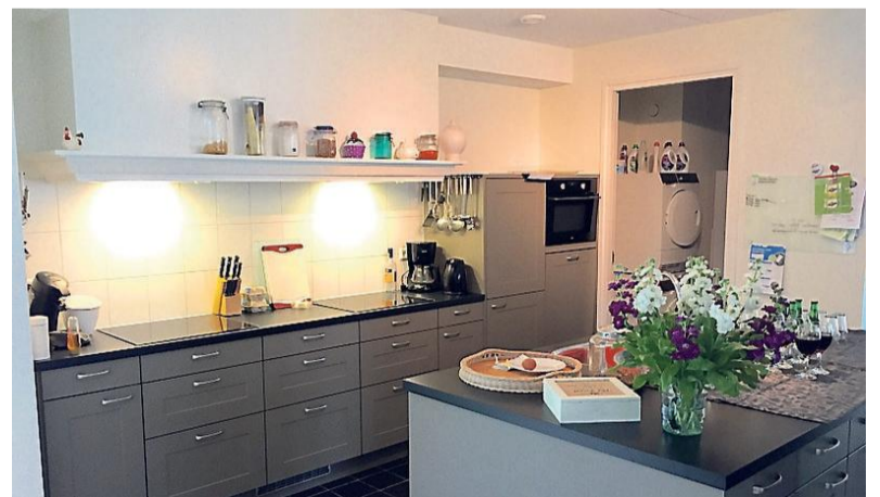
Van boven naar beneden: het thuishuis in Harderwijk, een zelfstandig woonruime én de gezamenlijke keuken.

hoorde ik van woonvormen als dit. Toen dat in Harderwijk kwam, ben ik er achteraan gegaan. Om hier te gaan wonen is een groot avontuur, dat tot op heden goed bevalt. We zijn nu net van twee naar zes bewoners gegaan. Dat is weer even wennen aan elkaar. Tevoren heb je een kennismakingsgesprek. Dat geeft een indruk. De wooncorporatie,